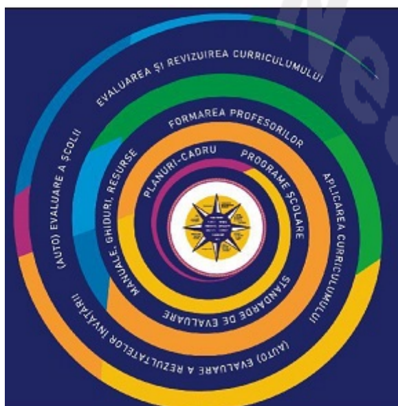
Figura 2**). Continuumul predare-învățare-evaluare

Continuumul predare-învățare-evaluare reunește elementele de construcție curriculară, de suport al curriculumului, de aplicare și evaluare a acestuia: