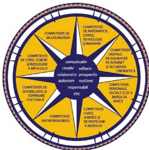
Figura 1*). Dimensiuni principale care contribuie la definirea profilului de formare al absolventului