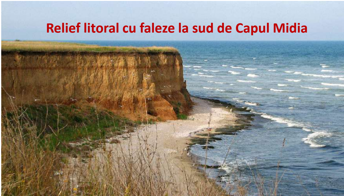
Relief litoral cu faleze la sud de Capul Midia