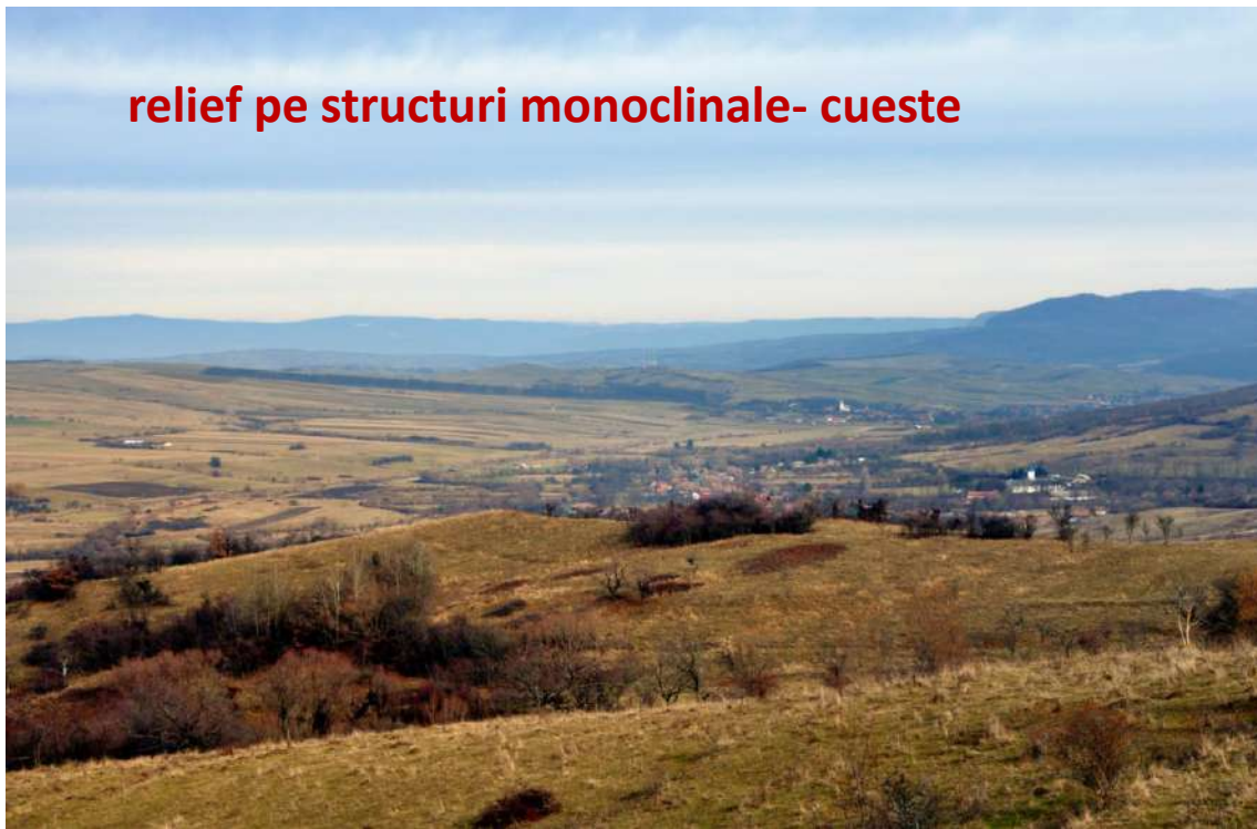
relief pe structuri monoclinale- cuate