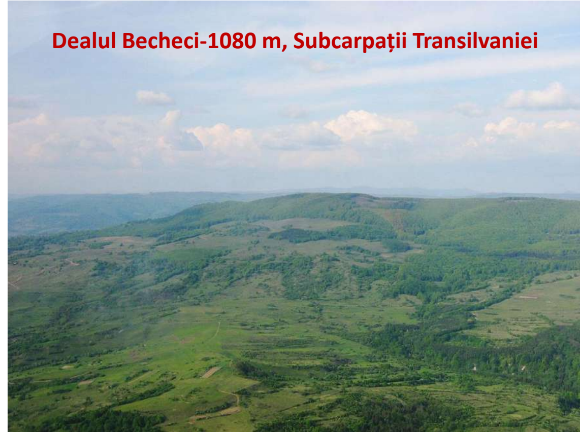
Dealul Becheci-1080 m, Subcarpații Transilvaniei