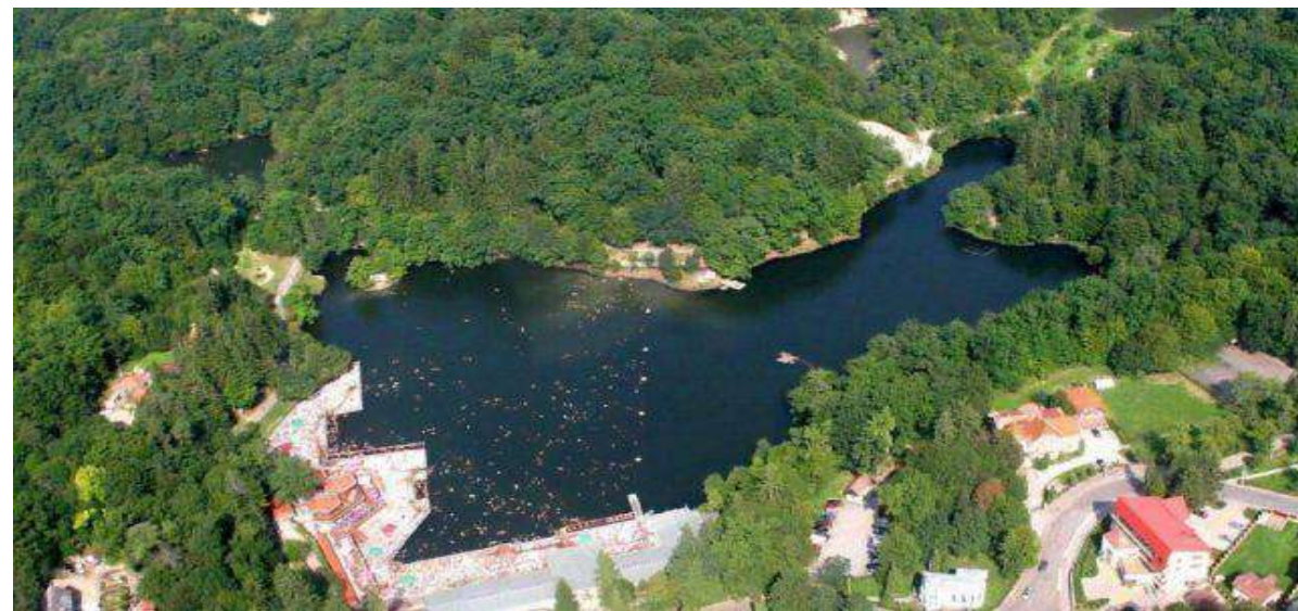
Lacul Ursu- Sovata