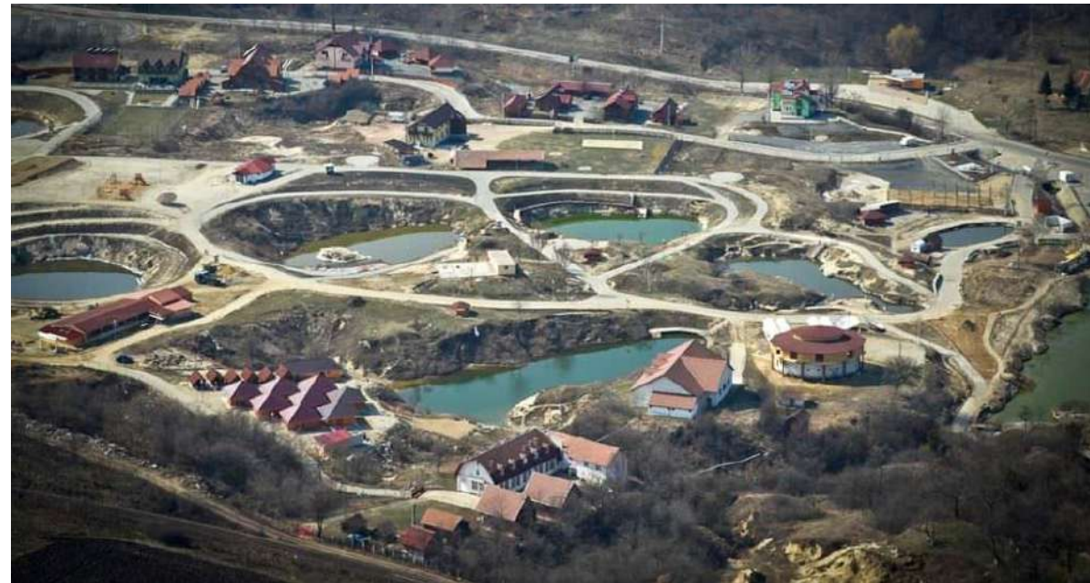
Iacurile de la Ocna Sibiului